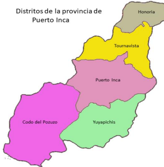
FIGURA N° 01 DISTRITOS DE LA PROVINCIA DE PUERTO INCA

Fuente: Familysearch (2020) Districts of the province of Puerto Inca 3